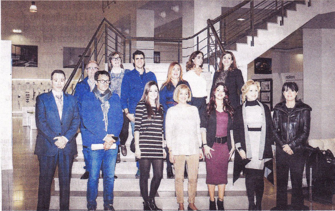
Premiados del certamen y miembros del Codid-RM. Porcelanosa